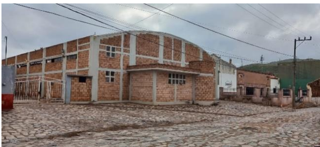
DEPORTIVO: "ALONSO DE LLERENA"