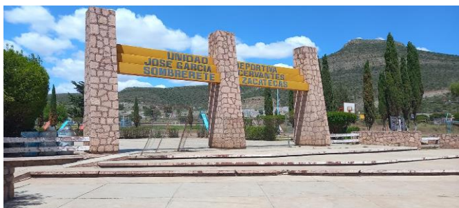
UNIDAD DEPORTIVA: “PROFR. JOSÉ GARCÍA CERVANTES”