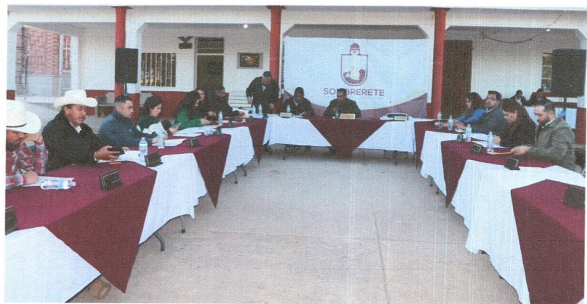
45 ASAMBLEA GENERAL 25A SESIÓN EXTRAORDINARIA(ITINERANTE), MISMA QUE TUVO VERIFICATIVO A LAS 17:10 HRS, DEL DIA 11 DE NOVIEMBRE 2025, EN LA DELEGACIÓN MUNICIPAL, SOMBRERETE. ZAC. DE COL. GONZÁLEZ ORTEGA DEL MUNICIPIO DE SOMBRERETE.