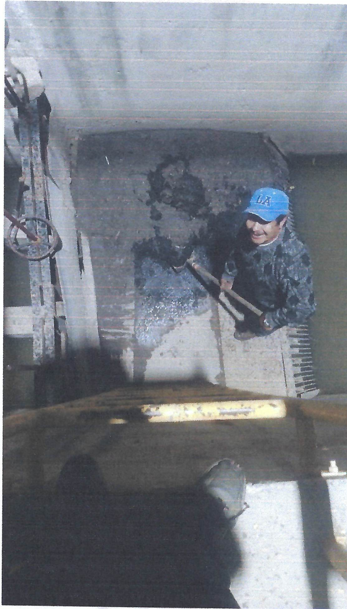
RETIRO DE LODOS DE AREA DE PRETRATAMIENTO