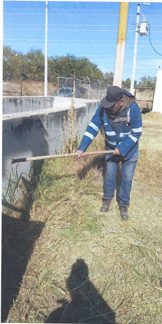
MANTENIMIENTO A CARCAMO SECUNDARIO