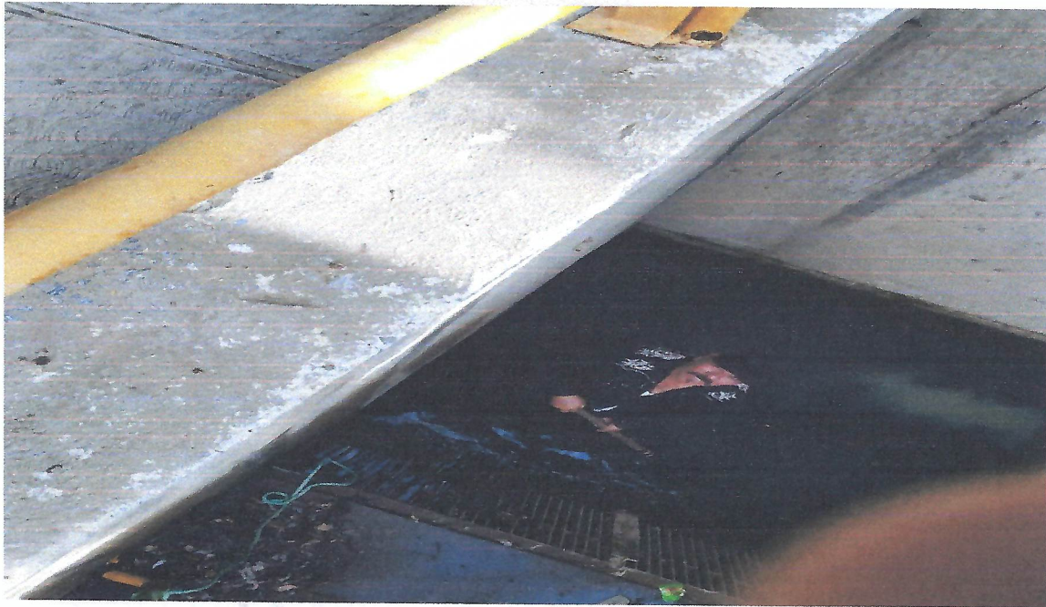
LIMPIEZA DE REJILLAS