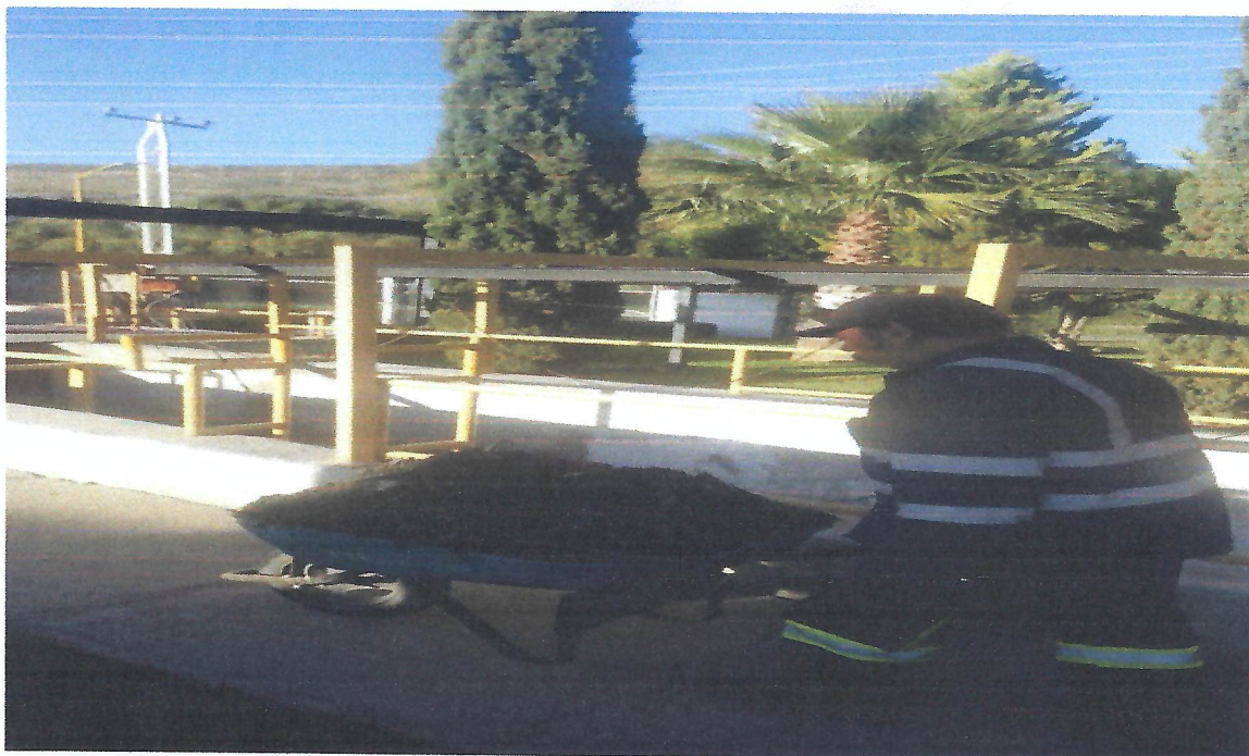
DESARENACION DEL AREA DE PRETRATAMIENTO