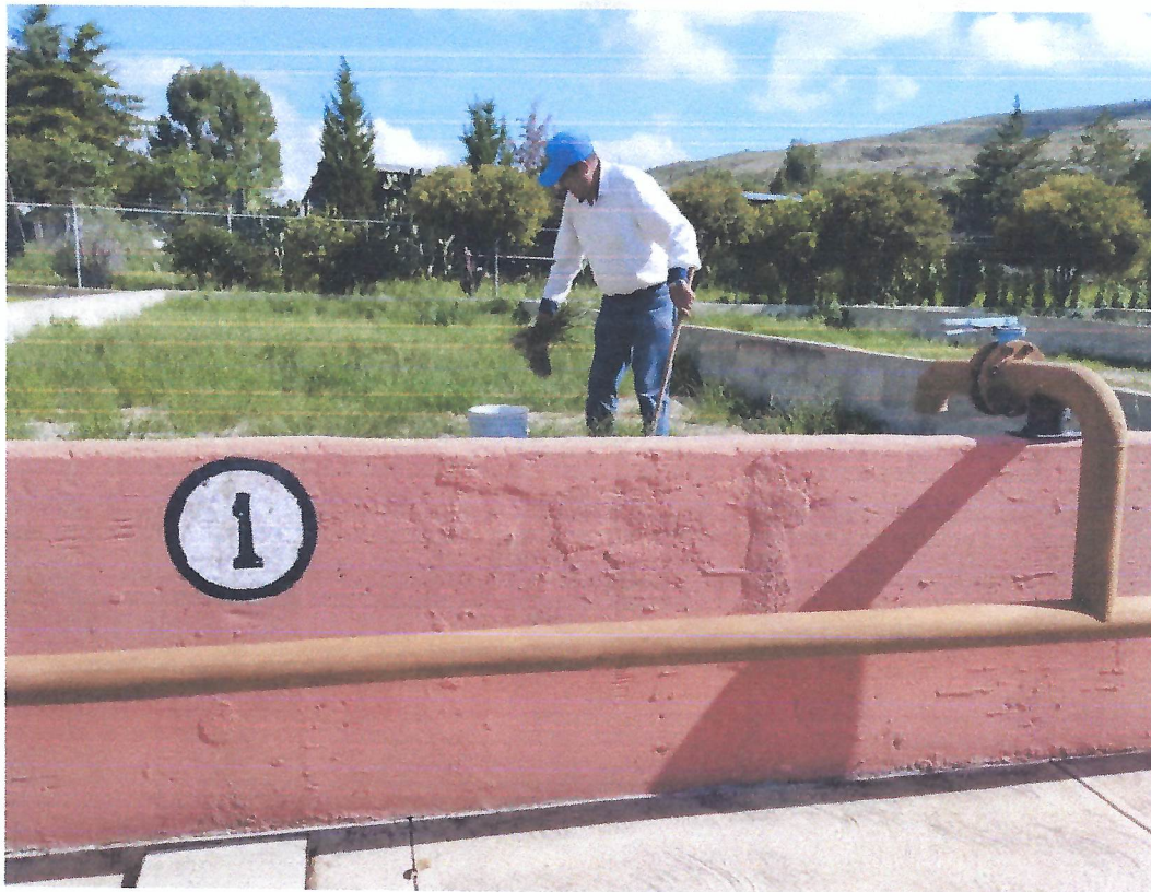
MANTENIMIENTO A LECHOS DE SECADO DE LODOS