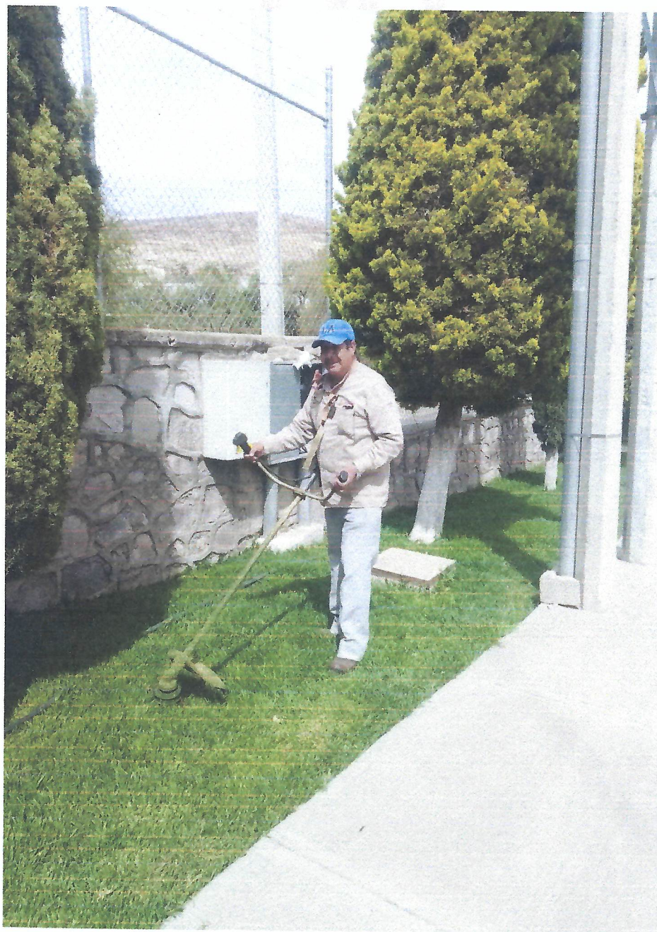
CORTE DE PASTO