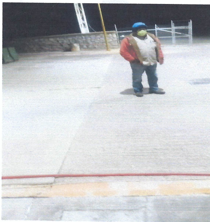
ACTIVIDADES DE VIGILANCIA