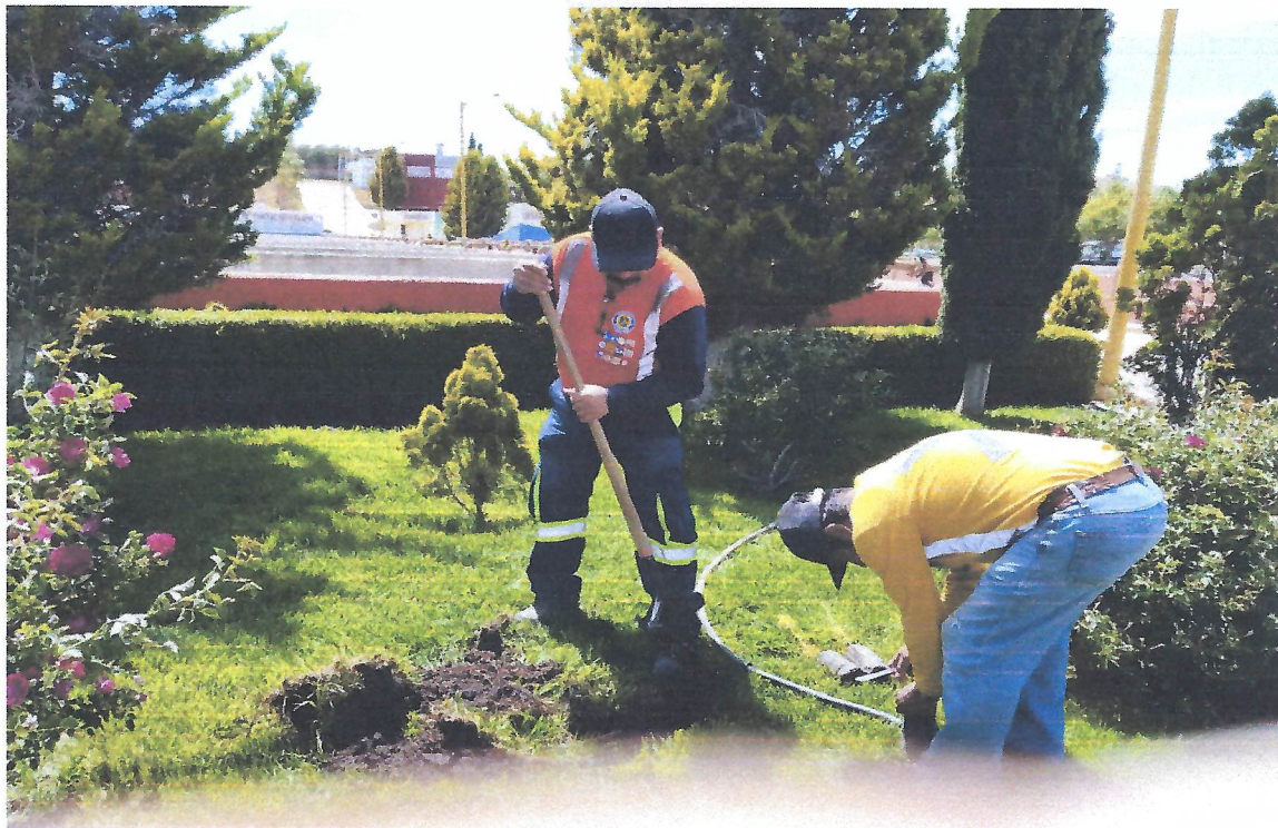
MANTENIMIENTO A AREAS VERDES