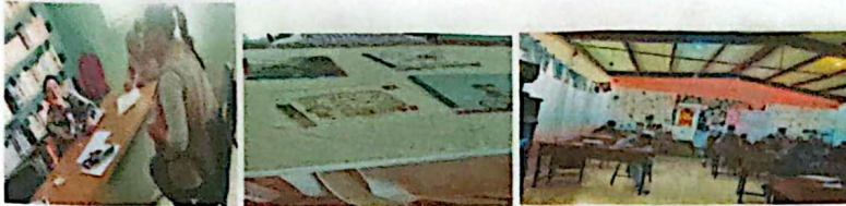
Mochila Viajera biblioteca y escuela de Benito Juarez