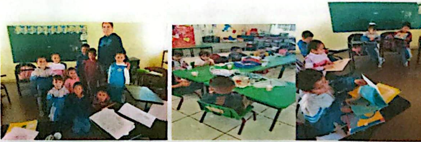
Mochila Viajera bibliotecas de Corrales