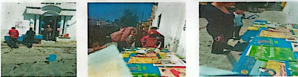
Exposicion de Biblioteca Municipal de Sombrete, Zac.