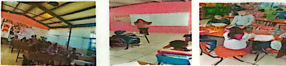
Actividades en la biblioteca de Benito Juarez