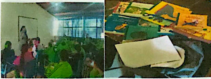
Mochila viajera alumnos de sexto de Primaria de la colonia hidalgo