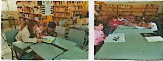
Biblioteca Gonzalez Ortega realizando tareas de la escuela, mama e hijos