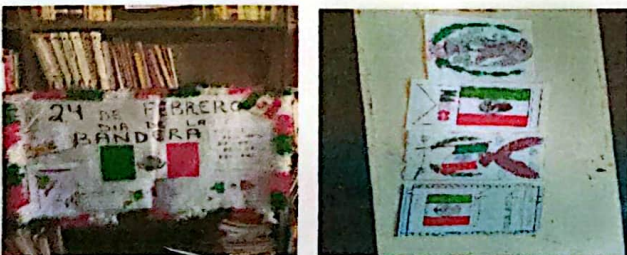
24 de feberero Dia de la Bandera