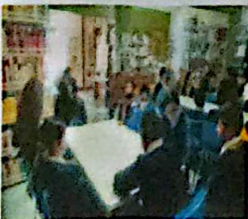
Niños en lectura y otras actividades e Biblioteca Publica Gonzalez Ortega