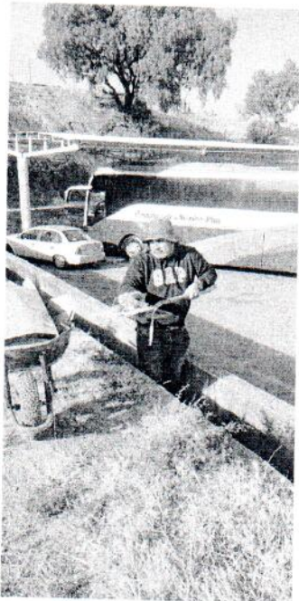
Limpieza de canal de desagüe