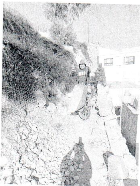
Ampliación a muro perimetral