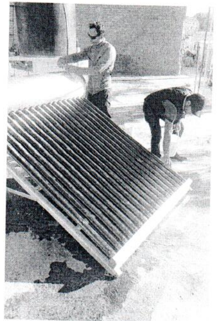
Mantenimiento a boiler solar