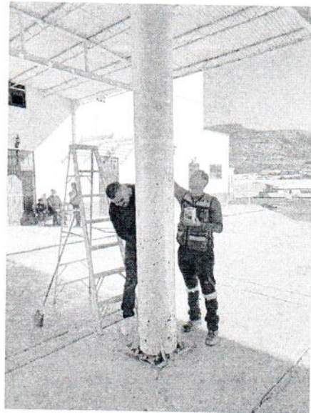
Mantenimiento con pintura a los pilares del área de andenes