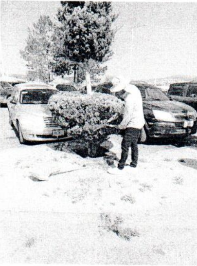
Podado de áreas verdes del estacionamiento

Por medio del presente le informo a usted de las actividades realizadas en estas instalaciones de la central camionera durante el mes de ENERO 2026.