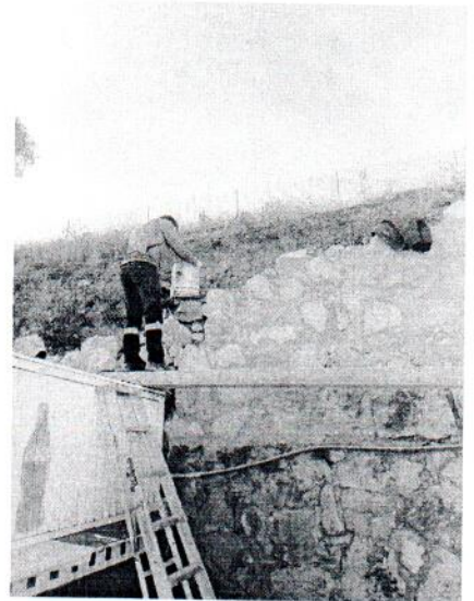
Ampliación a muro perimetral