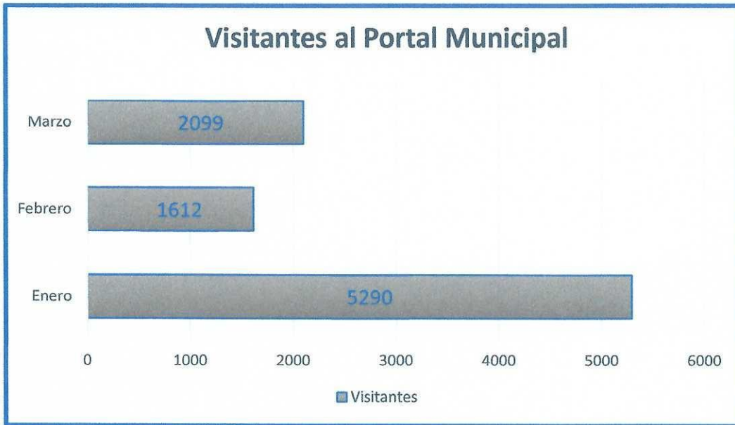
Gráfico 2. Total de visitantes del portal del municipio de Sombrerete del primer trimestre del año 2026.

Durante este trimestre se registraron un total de 9,001 visitantes al portal de este municipio, tal como se muestra en el siguiente gráfico, donde se desglosa la cantidad específica por mes.