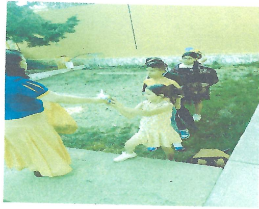
Actividad del Día del niño y de la Mochila Viajera con alumnos de 1° y 2° grado de la Escuela Primaria Valentín Gómez Farias ubicada en la comunidad de San Martín, en el municipio de Sombrerete, Zacatecas