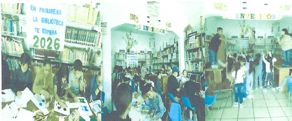
Curso de en la BOCA BOTA Y EN EL PIE REBOTA y Ba-llenaz de Historia en la B. Miguel Hidalgo de la Col Hidalgo,