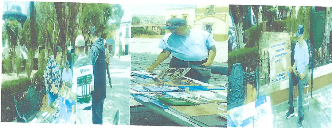
Con motivo del día del Libro , la biblioteca Sombreretenses Ilustres, turno matutino, realizó exposición de libros en el Jardín Constitución! Bonita tarde