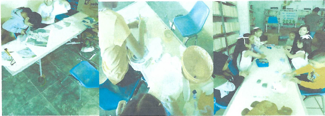
Actividades realizadas en el Curso de la biblioteca te espera del 7/11 de abril en la B,P, Sebastian Muro Barretero de la Comunidad de Ex hacienda Zaragoza